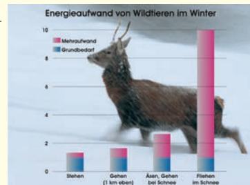
Der Energieverbrauch steigt bei der Flucht im Schnee enorm!